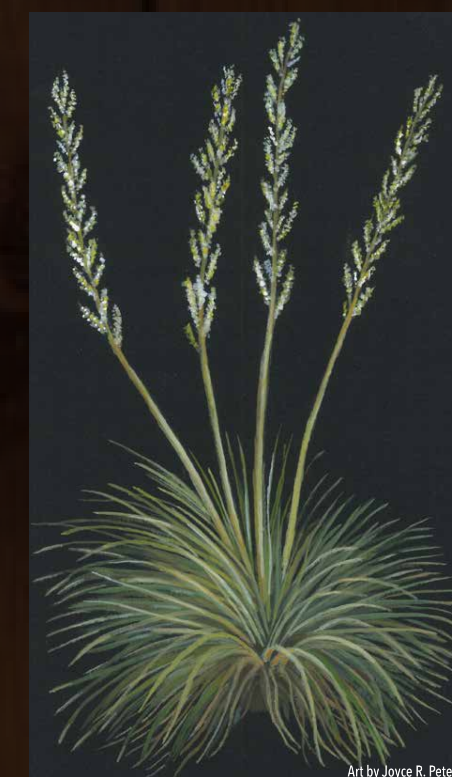
common Beargrass Tohono O'odham Mohō Latin Nolina microcarpa Spanish Sacahuista

Within Tohono O'odham culture, there may be no more important object than the basket. Woven together using local plant materials, baskets are used in nearly all aspects of life. In addition to continuing this ancient cultural tradition, modern basketmaking provides a significant source of income for O'odham weavers who are considered among the finest indigenous basketmakers in North America.