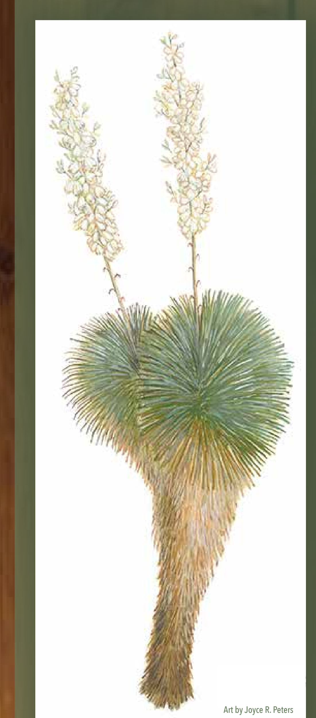
common Soaptree Yucca Tohono O'odham Takui Latin Yucca elata Spanish Palmilla