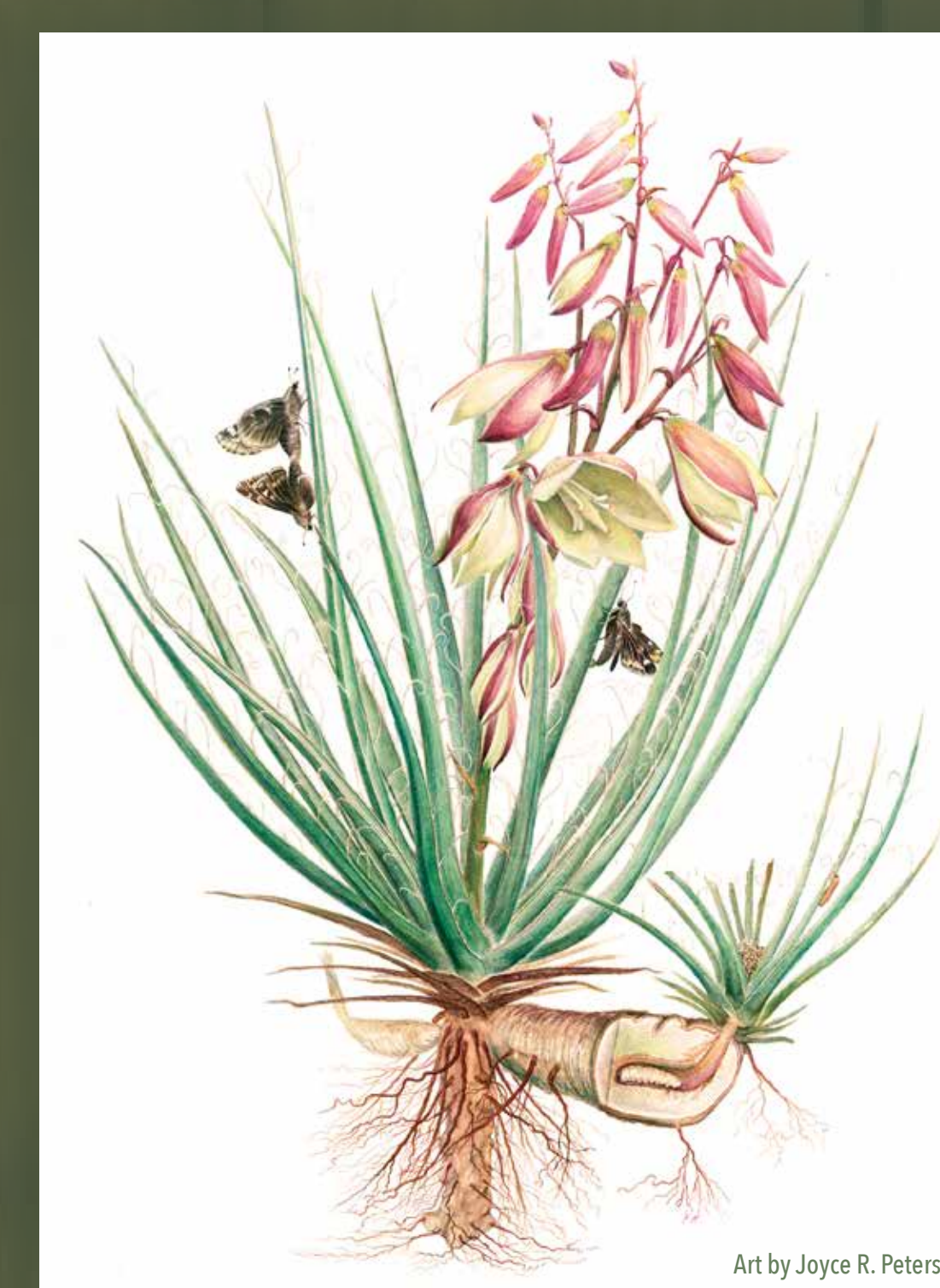
common Banana Yucca Tohono O'odham Hoi Latin Yucca baccata Spanish Dátil

*el cosheado sostenible de plantas tradicionales está permitido. Contact el Coronado National Forest para más información.